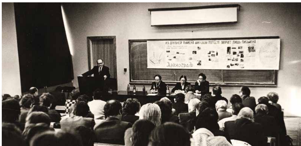
Конференция, посвященная 25-летию археографической экспедиции Научной библиотеки КГУ. Казань, 22 ноября 1988 г.

Conference dedicated to the 25th anniversary of the Archaeographic expedition of the Scientific Library of KSU. Kazan, November 22, 1988.