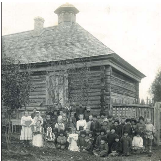
Ученики Смол- деярвской школы грамо- ты. Нач. XX в. Из фондов Музея Лаишев- скаго края им. Г.Р. Державина