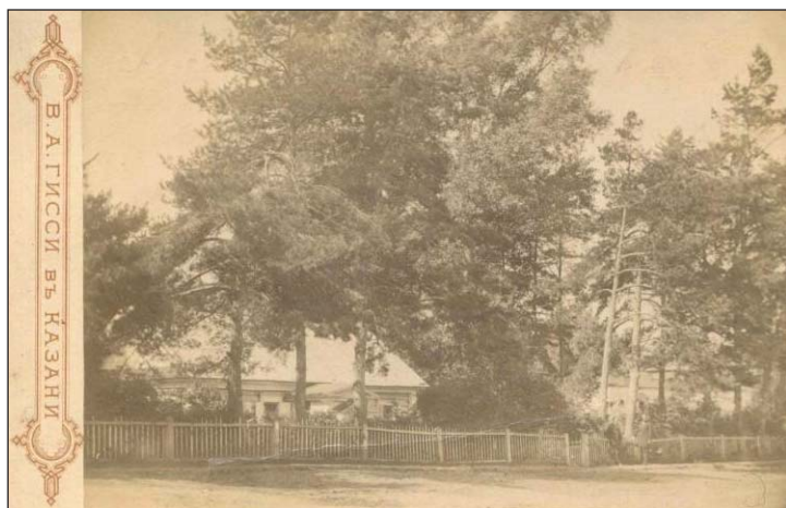
Поместье Лебедевых Лаишевского уезда. Фотография 1870–1899 гг.