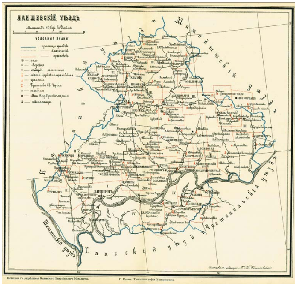
Карта Лайшевского уезда Казанской губернии 1895 г.