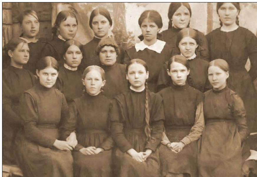
Ученицы Лаишевской женской гимназии. 1918 г. Из фондов Музея Лаишевского края им. Г.Р. Державина