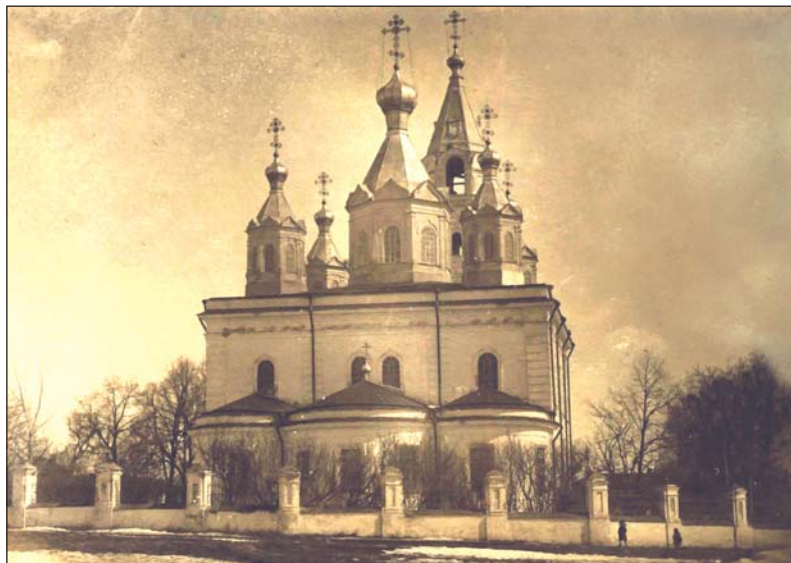
Софийский собор. 1905 г.

Грамота о посвяще- нии в степень ие- рархскую дьякона Рафаила Дмитриев- ского во храм в селе Крещеных Янасалах Лаишевского уезда от имени архиепи- скопа Казанского и Свяжского Дмитрия. 11 марта 1906 г.