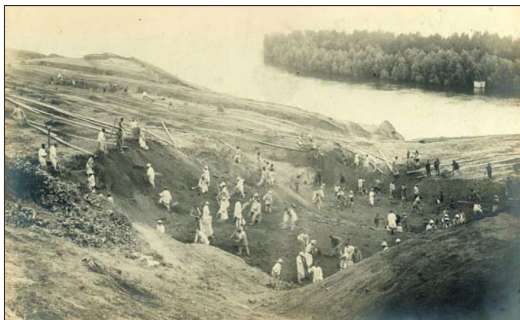
Строительство Лаишевского тракта (дамбы Казань – Лаишево). Фотография нач. XX в.