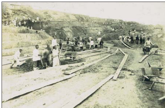
Строительство Лаишевского тракта (дамбы Казань – Лаишево). Фотографии нач. XX в.