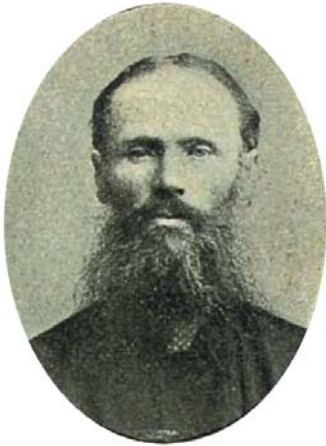
Батуров Михаил Васильевич (род. в 1857 г.) – депутат II Государственной думы.