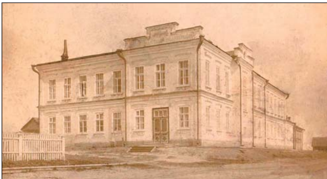
Лаишевское низшее ремесленное училище. 1910 г.