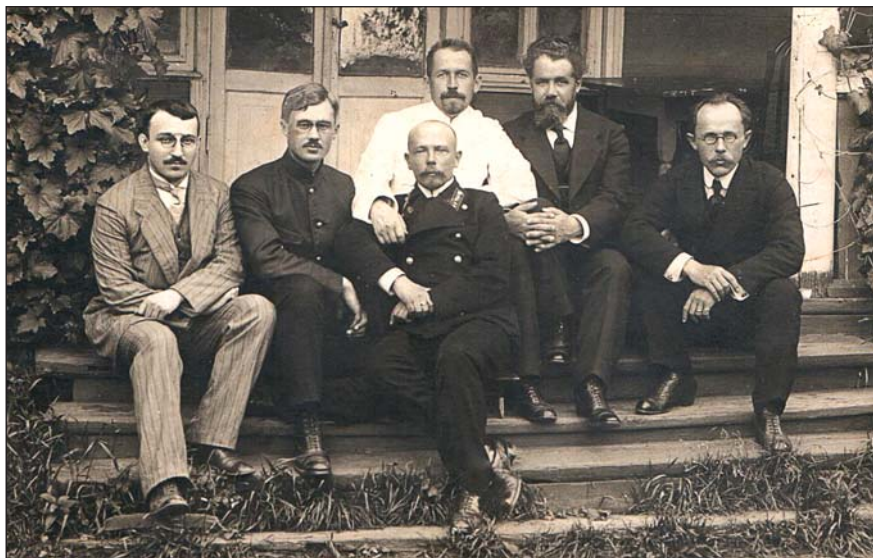
Учителя г. Лаишев. Из фондов Музея Лаишевского края им. Г.Р. Державина