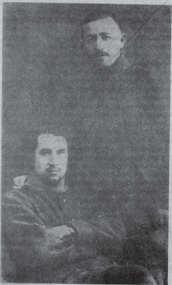
М. Султан-Галиев и И. Фирдевс. Снимок 1925 г.