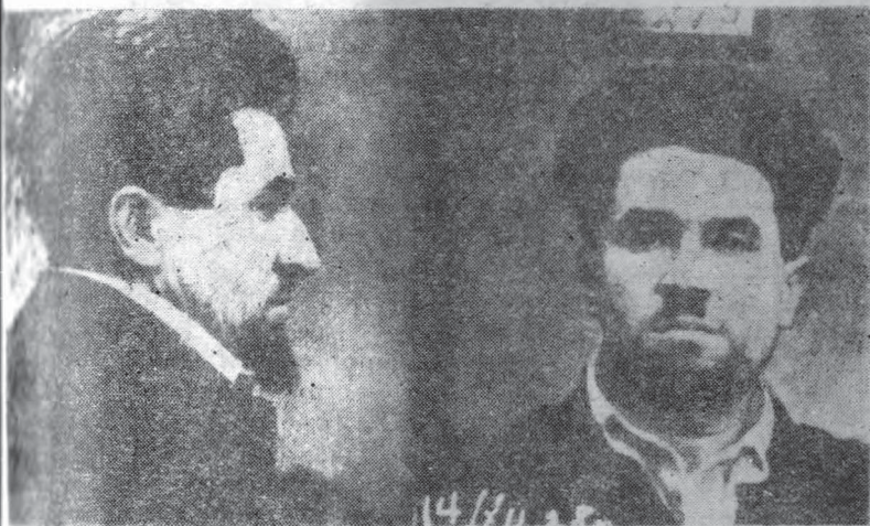
М. Султан-Галиев. Снимок сделан после второго ареста.