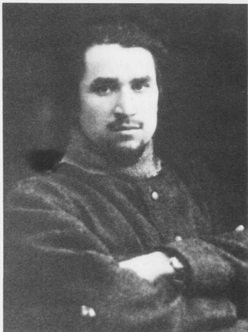
М.Х. Султан-Галиев. 1919г.