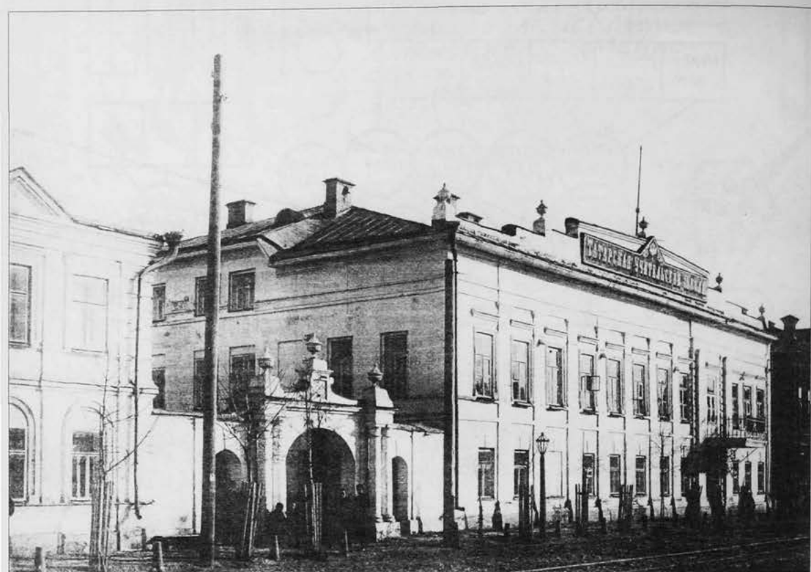
Здание Татарской учительской школы в Казани (ул. Тукаевская, 73).