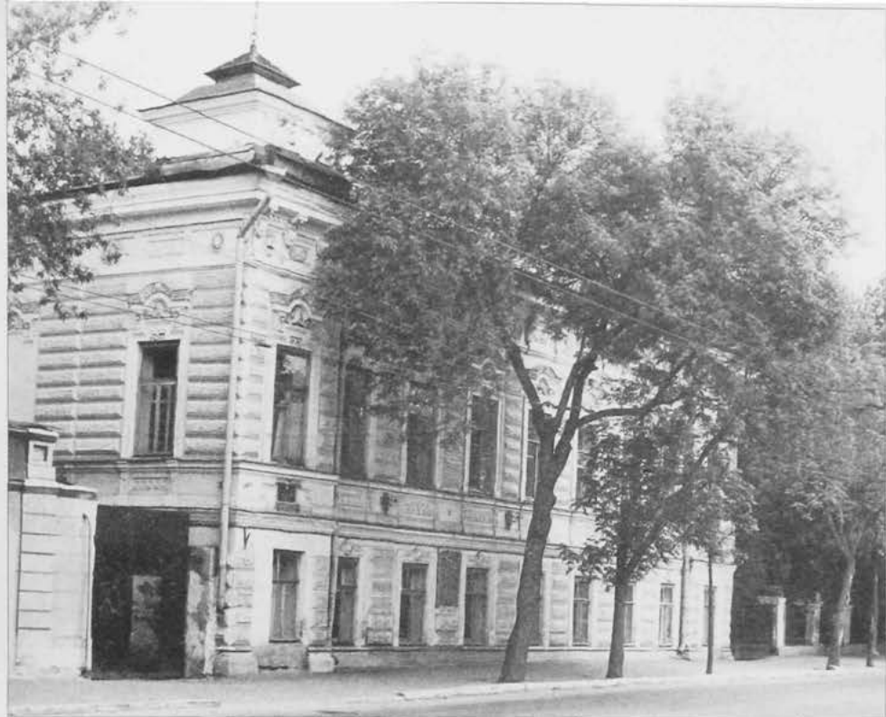
Дом Землянова в Казани (ул. Кирова, д.37), где с января 1918г. размещался Мусульманский социалистический комитет. Июнь 1998г.