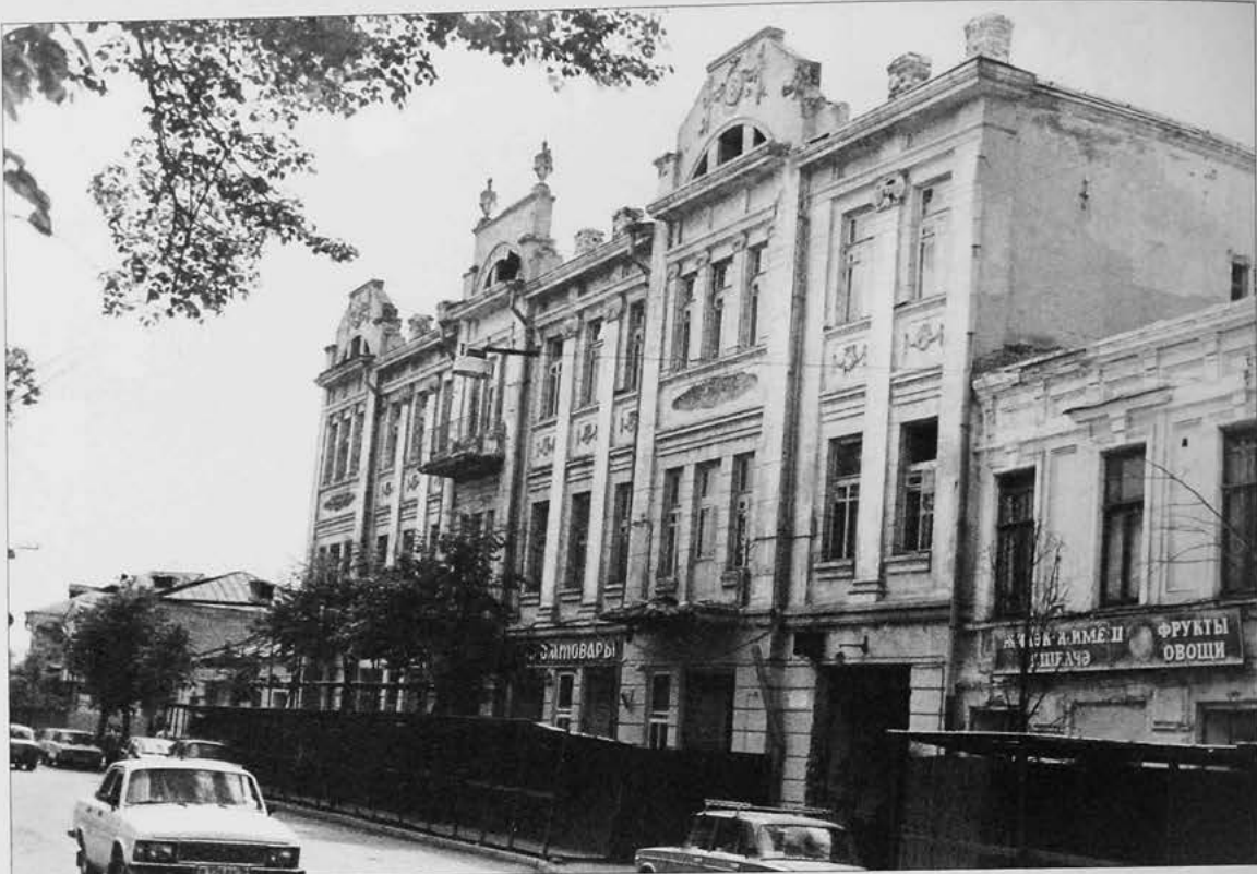
Дом Стахеевых в Казани (ул. Лобачевского, д.9), где в 1918г. размещался Мусульманский комиссариат. Июнь 1998г.