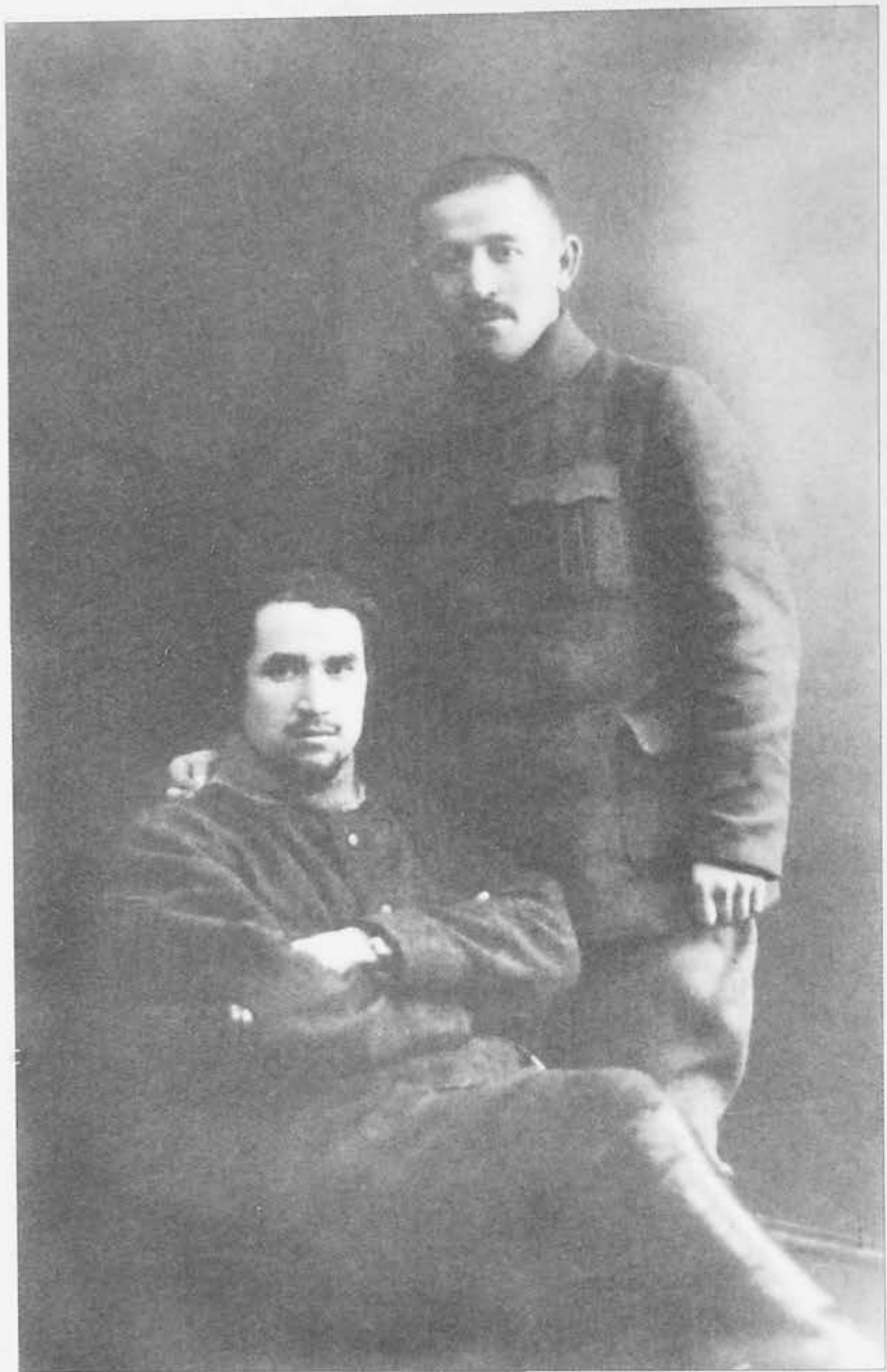
М.Х. Султан-Галиев, И.К. Фирдевс. 1919г. (ЦГА ИПД РТ.-Ф.8237.-Оп.1.-Д.36).