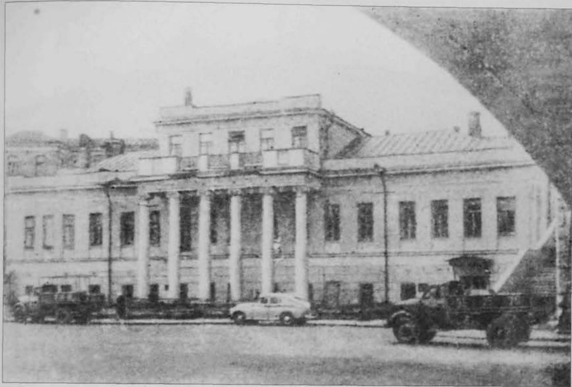
Здание в Москве (ул. Кремлевская набережная, д.9), где размещались Центральный мусульманский комиссариат и Центральная мусульманская военная коллегия.