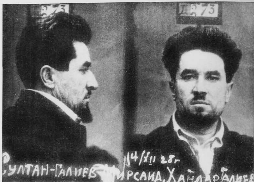
М.Х. Султан-Галиев. 14 декабря 1928 г. Тюремное фото.