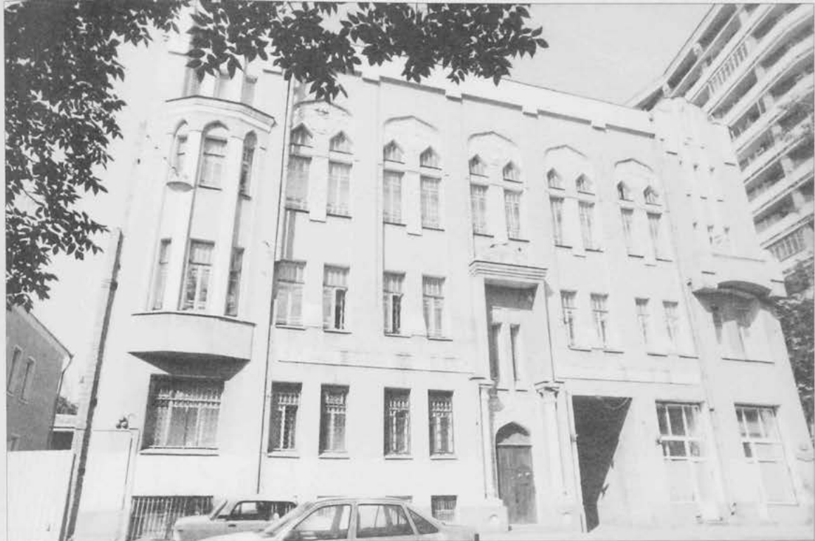
Дом Асадуллаева в Москве (Татарский переулок, д.8), где в 1918-1923гг. проходили собрания, конференции, съезды мусульманских военных и партийных организаций. 1998г.