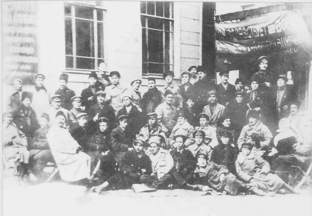
М.Х. Султан-Галиев среди делегатов I Всероссийского съезда мусульманских коммунистов. Между 4-12 ноября 1918г.