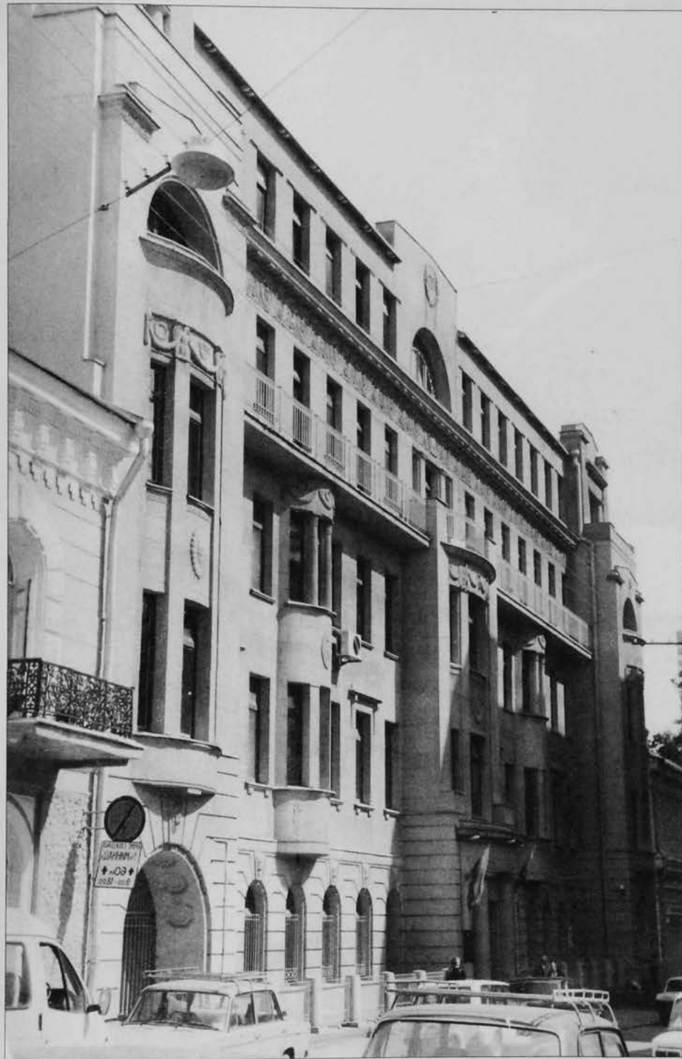
Здание в Москве (Трубниковский переулок, 19), где размещался Народный комиссариат по делам национальностей, членом коллегии которого М.Х. Султан-Галиев являлся с мая 1920г. по 4 мая 1923. 1998г.