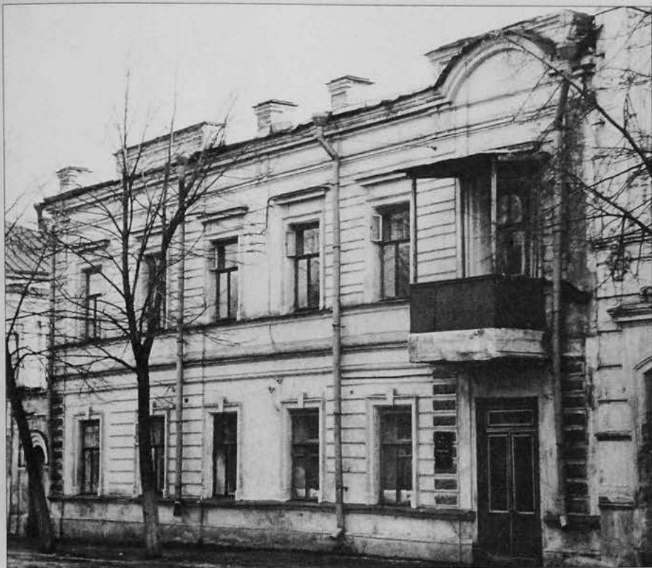
Здание в Казани (ул. Островского, д.6), где в 1919-1920гг. размещалась Центральная мусульманская военная коллегия. 1998г.