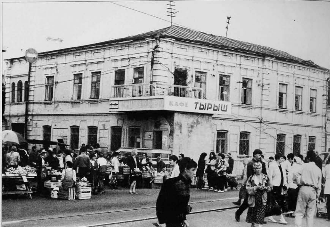
Здание в Казани (ул. Тукая, д.1), где с апреля 1917г. по декабрь 1917г. размещался Мусульманский социалистический комитет. Июнь 1998г.