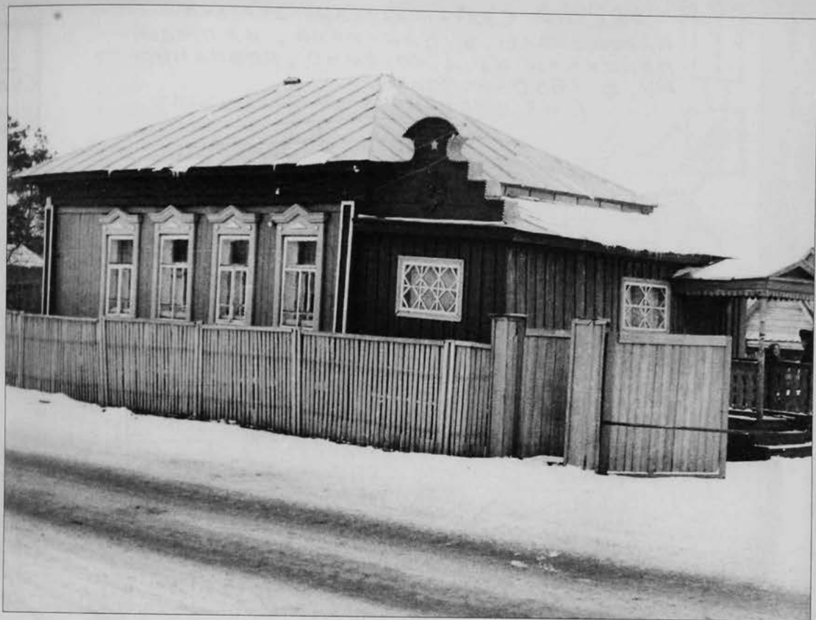
Дом Хайдаргалия Султан-Галиева, отца М.Х. Султан-Галиева, в Кармаскалах. Б/д. (ЦГА ИПД РТ.-Ф.8237.-Оп.1.-Д.50.).