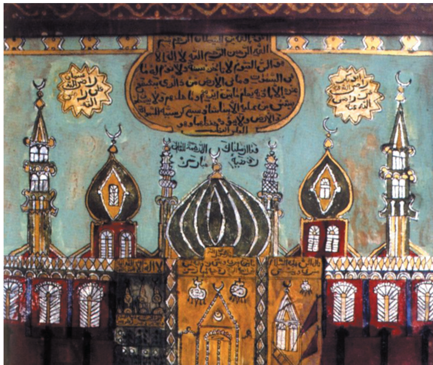
Татарский шамайль начала XX века.