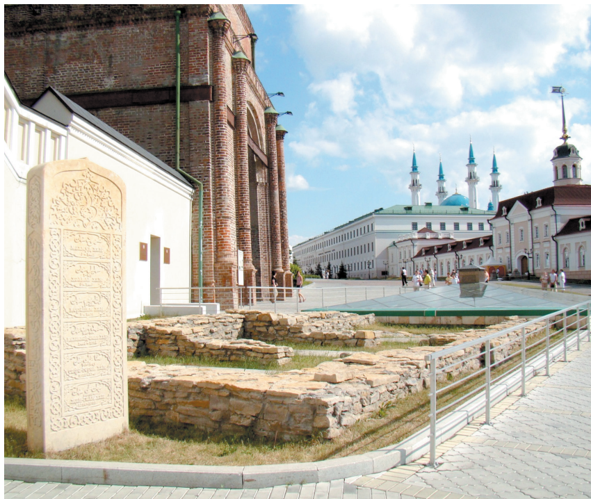
В Казанском кремле

Широкой полилингвальности и мультикультурности населения ханства особо способствовали богатая традиция исламского просвещения (базирующаяся на «гыйлем – стремлении к знанию» 66 ), высокоразвитая система мусульманских учебных заведений (мектебов и медресе при всех мечетях страны, в которых обязательно