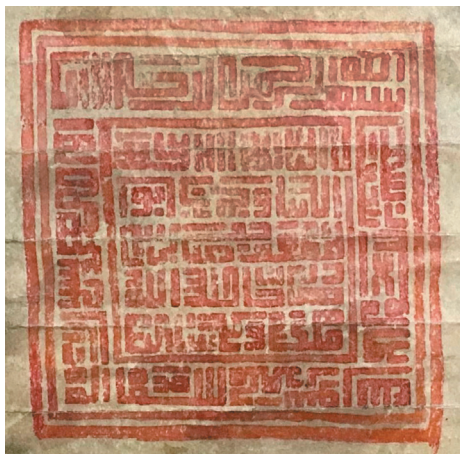
Нишан (печать) ярлыка хана Сахиб-Гирея

Кул-Мухаммад и его брат Кул-Шериф имели прямое отношение к последователям Ахмеда Ясави 33 . Татарские предания дают возможность говорить о главенстве тариката Ясавийа в Среднем Поволжье как минимум со времен поздней Золотой Орды. Встречающаяся практически во всех областях культуры (в архитектуре, поэзии, каллиграфии и т.д.) в большом количестве суфийская символика подтверждает