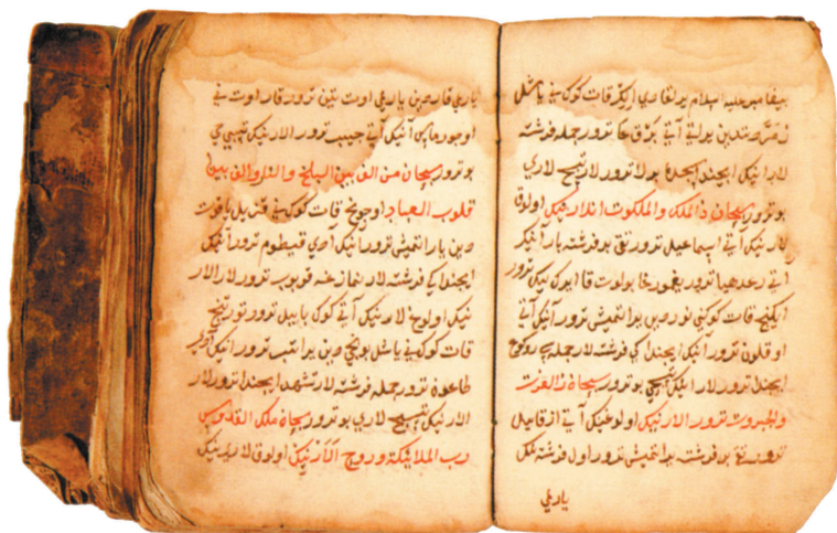
Аднаш-хафиз. Светоч сердец. Список 1554 года

феодалную знать вышеуказанных народов, также была исламизированной. В русских письменных источниках XV–XVI веков жители Казанского государства именовались «безбожными», «богомерзскими», «нечестивыми», «окаянными» (в смысле – «безбожными»), «бесовскими», «греховными», «нечестивыми», «проклятыми»), «погаными» (в смысле – «язычниками» и «иноверцами»), «варварами», «агарянами» и «измаильтянами» (Агарь/Хаджар и Измаил/Исмаил в библейско-коранической традиции считаются прародителями арабов), «срацынами» и «бессерменами» (греческое «сарацины», производное от арабского «шарк»/«восток», обозначало в целом «восточных людей» и арабов в частности; слово «бу сурман»/«басурман»/«бесермен» обозначало иноплеменника мусульманской веры) 55 . Многочисленные мусульманские кладбища и отдельные погребения («святые места») с надгробными памятниками с цитатами из Корана на бывшей территории Казанского