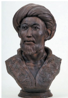
Хан Махмуд. XV век. Реконструкция Татьяны Балугево

Исторические источники свидетельствуют, что уже со второй четверти XIV века в Золотой Орде главенствовал ханафитский мазхаб суннитского ислама, с активным использованием местных обычаев и юридической практики («горегадат»/«адат»); этот мазхаб позднее был широко распространен в Астраханском, Казанском, Касимовском, Крымском и Тюменском/Сибирском татарских ханствах 5 . И здесь везде именно мусуль-