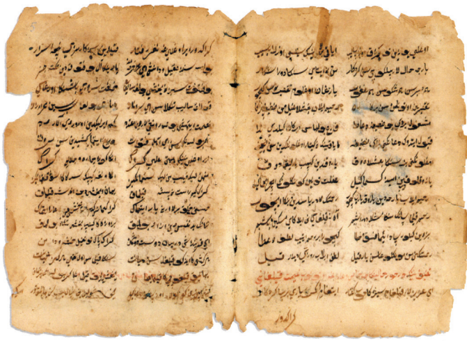
Мухаммадьяр. Дар мужей. Список XVIII века

ханства 56 ясно свидетельствуют о преобладании исламской веры в среде местного населения. По-видимому, из 400–500 тысяч человек, проживавших в Казанском государстве в середине XVI века,