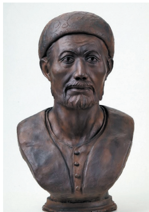
Хан Мухаммад-Амин. XVI век.

Структура духовенства Казанского ханства была достаточно четкой и разветвленной. В письменных, фольклорных и археологических источниках, в частности в татарских надмогильных эпитафиях, есть информация о верховных и меньших сейидах и сейид-заде (сейидовых сынах), шейхах (видных мусульманских деятелях, богословах, знатоках преподавания религиозных дисциплин, главах суфийских братств) и шейх-заде (сыновьях шейхов), хакимах (главных судьях и провинциальных наместниках) и казьях/кадиях (народных судьях), факыйхах (знатоках исламского права), муллах (знатоках Корана и религиозных обрядов) и муллазаде (сыновьях мулл), имамах (богословах, контролирующих ра-