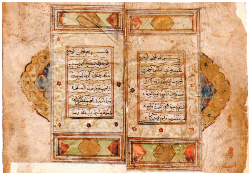
Коран. Список 1699 года

люди – ступней, а простой народ (плебеи) – только его платья или лошади» 19 .