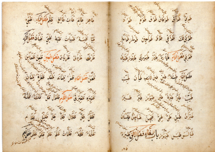
Хаджибайрам. Арабо-татарский словарь. 1581 год

вышнему Творцу (Аллаху 52 ) и пророку Мухаммаду, к собственной судьбе, к природе и смыслу «земной власти» и т.д. 53 .