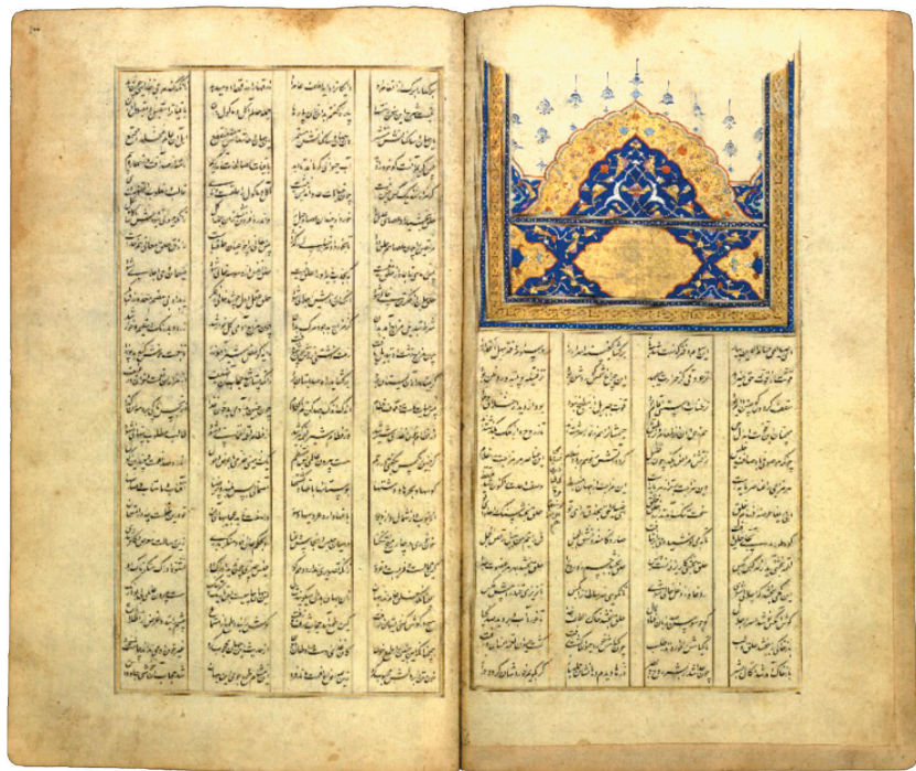
Фрагмент персоязычной рукописи 1472 года

го духовенства (верховный сейид, потомок пророка Мухаммада и «Льва Аллаха» – халифа Али ибн Абу Талиба 11 ) возглавлял государственный совет (Диван) и, нередко, – «собрание всей земли Казанской» (курултай), активно участвовал в ключевых процес-