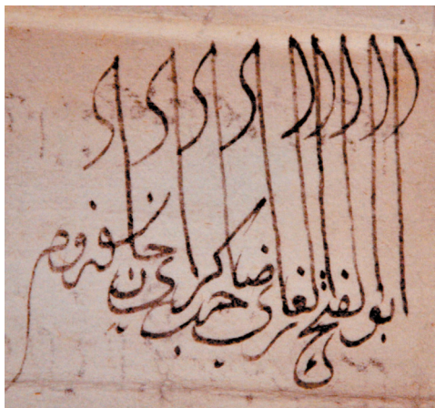
Тугра крымского хана Сахиб-Гирея

Отмечая доходы, получаемые духовенством с земельных поместий, нельзя обойти вниманием и перечень податей и повинностей, имевших место в Казанском ханстве. Подробный их список в свое время был составлен Ш.Ф.Мухамедьяровым в его кандидатской диссертации «Социально-экономический и государственный строй Казанского ханства (XV – первая половина XVI вв.)» 37 . Сугубо