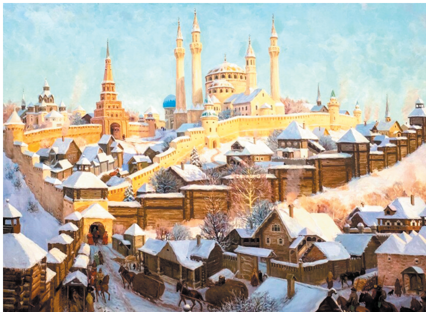
Столица Казанского ханства — Казань. Худ. Фиринат Халиков