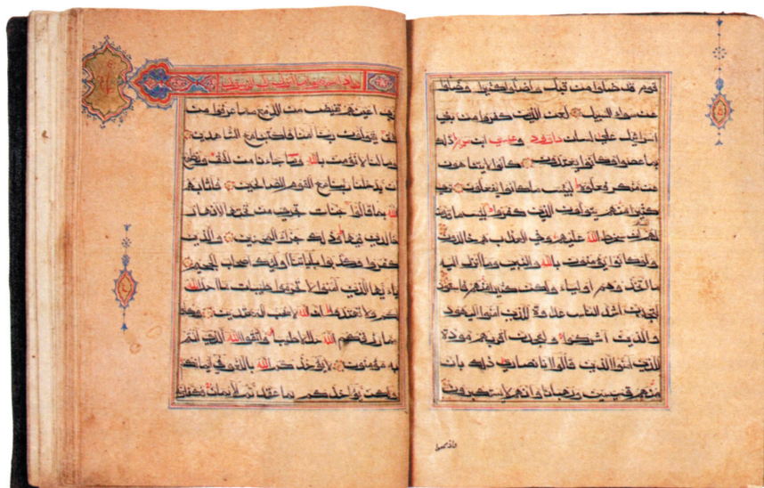
Коран. Список первой половины XVII века