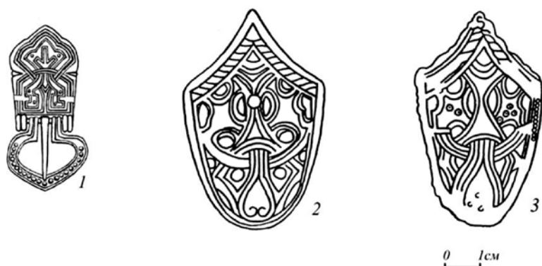
Рис. 3. Изображения божества с головами животных за плечами: 1 – пряжка из погр. 151 Кельгининского могильника (Зубово-Полянский р-н Республики Мордовия), бронза; 2 – наконечник ножен меча из погр. 94 могильника Жасинас (Шилальский р-н Литовской Республики), бронза; 3 – наконечник ножен меча из погр. 117 могильника Ирзекапинис (Зеленоградский р-н Калининградской обл.), бронза. 1 – Археологический музей Мордовского госуниверситета; 2, 3 – по: Кулаков, 2003. Рис. 1, 2, 3