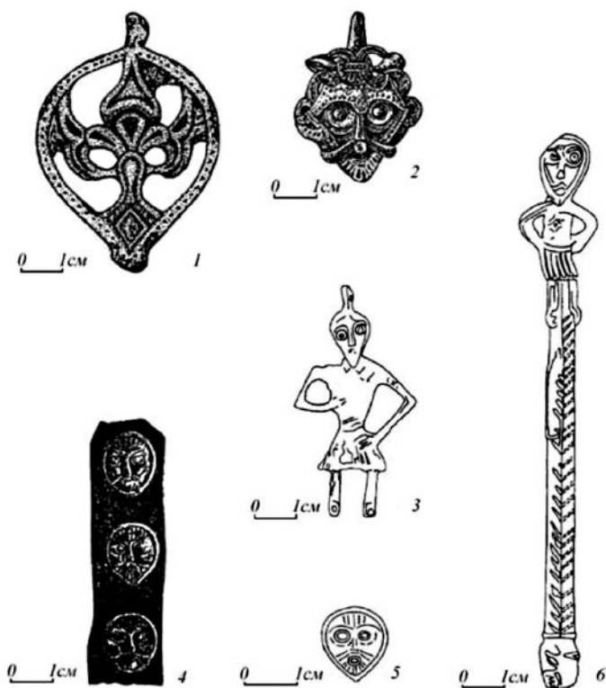
Рис. 4. Изображения божества с асимметричными глазами: 1 – подвеска из Кельгининского могильника (Зубово-Полянский р-н Республики Мордовия); 2 – подвеска из Гнездова, клад 1868 г.; 3 – подвеска из Новгорода; 4 – ременные бляшки из Лядинского могильника (Тамбовская обл.); 5 – бляшка из Пановского могильника (Пензенская обл.); 6 – фигурка из Новгорода. 1 – фонды Мордовского республиканского объединенного краеведческого музея; 2 – по: Седов, 1982. Табл. LXVIII – 6; 3, 6 – по: Кулаков, 2003. Рис. 1 – 6, 7; 4 – по: Альбом древностей мордовского народа, 1941. Табл. VIII – 9; 5 – по: Материальная культура среднецентинской мордвы VIII–XI вв., 1969. Табл. 17 – 6