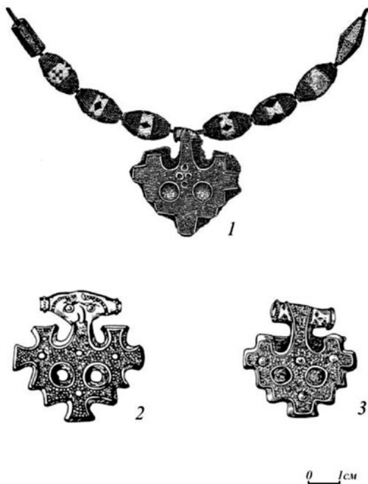
Рис. 1. Крестообразные подвески с бессистемной зернью: 1 – Ефаевский могильник (Краснолободский р-он Республики Мордовия), серебро с остатками позолоты; 2 – Хиддензее, клад (Дания), золото; 3 – Киев, клад 1903 г. на территории Михайловского монастыря, серебро. 1 – фонды Мордовского республиканского объединенного краеведческого музея им. И.Д. Воронина; 2, 3 – по: Новикова, 1993. Рис. 3, 3,4.