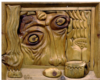
Ә.Фәтхетдинов. Шүрәле тәрәза янында. 1990 ел. Агач. А.Фатхутдинов. Шурале у окна. Дерево. 1990 г. 66×73 см. Инв. № КП-8502