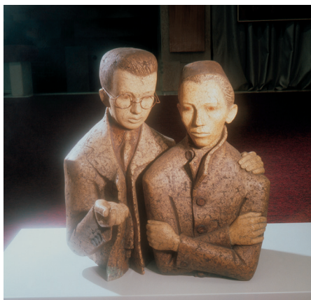
К.Замитов. Г.Тукай һәм Ф.Әмирхан 1990 ел. Шамот. К.Замитов. Г.Тукай и Ф.Амирхан 1990 г. Шамот. 72×70×60 см. Инв. № КП-10803