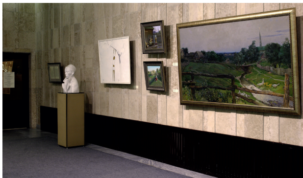
Г.Тукайның 125 еллыгына багышлан «Казан» милли мәдәният үзәгендә оештырылган күргәзмәдән күренешләр. 2011 ел. Фрагменты выставки, посвященной 125-летию со дня рождения Г.Тукая, организованной в НКЦ «Казань». 2011 г.