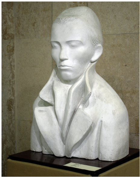
К.Замитов. Г.Тукай 1990–1992 еллар. Шамот. К.Замитов. Г.Тукай 1990–1992 гг. Шамот 140×45см. Инв. № КП–10461