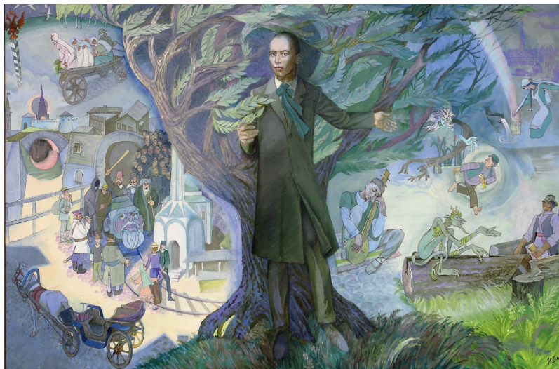
И.Әхмәдиев. Тукай турында сюита. 2009 ел. Киндер, майлы буяу. И.Ахмадеев. Сюита о Тукае 2009 г. Холст, масло