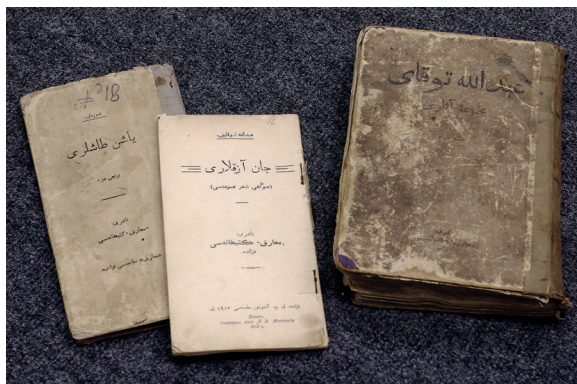
Г.Тукайның төрле елларда басылып чыккан китаплары. Книги Г.Тукая, изданные в разные годы