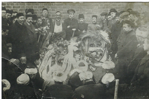
Тукайны соңгы юлга озату 1913 ел. Казан. Фотооткрытка. Похороны татарского поэта Г.Тукая 1913 г. Казань. Фотооткрытка 13,1×8,7 см. Инв. № КП-12917/3