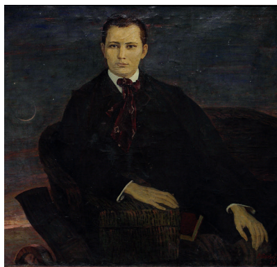
Р.Вахитов. Г.Тукай портреты 1986 ел. Киндер, майлы буяу. Р.Вахитов. Портрет Г.Тукая. 1986 г. Холст, масло