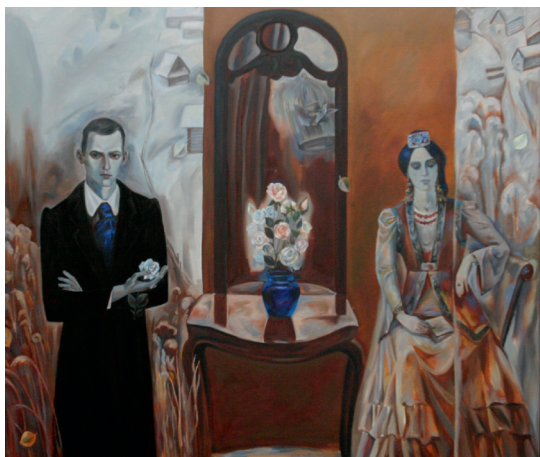
Р.Килдебәков. Шигырь дәфтәрәннән 1993 ел. Киндер, майлы буяу Р.Кильдебекөв. Из поэтической тетради 1993 г. Холст, масло 175×145 см. Инв. № КП-13734