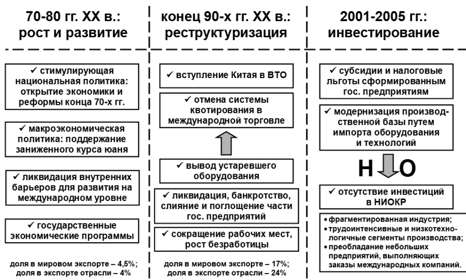
Рис. 2. Этапы модернизации отрасли легкой промышленности в Китае

– поддержку деятельности компаний и провинций по созданию, развитию и укреплению национальных брендов.