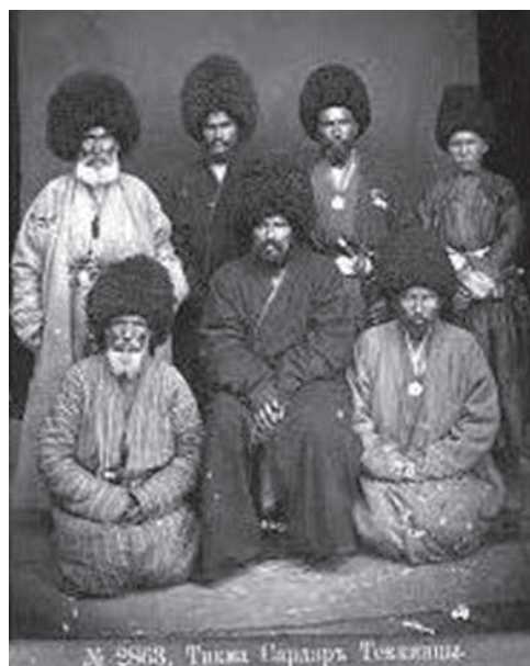
Дыкма-Сердар (сидит в центре) и его сын Ораз-Берды (стоит, первый справа). Санкт-Петербург, май 1881 г.

Примечательно, что архивные источники содержат конкретную дату рождения Ураз-Берды (Ораз-Сердара) – 7 января 1871 года. Военное образование он получил в кадетском корпусе и Николаевском кавалерийском училище. Прослежена хронология присвоения ему военных званий до 1904 года: корнет (ст. 4.08.1892), поручик (ст. 4.08.1896), штабс-ротмистр (ст. 1.06.1900), ротмистр (ст.