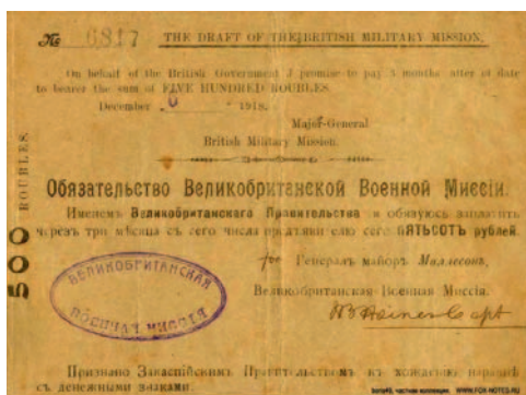
Банкноты с обязательством Британской военной миссии

пийскому правительству и его английским покровителям вовремя производить через банки оплату по ценным бумагам с обязательствами Британской военной миссии. Можно не сомневаться, что «хозяева» изначально предполагали подобный финал своей финансовой сделки. Еще в 1926 году в печати отмечалось, что «многие из доверчивых держателей «маллесоновок» и по сей день крепко хранят их в полной надежде получить за них когда-либо английскими золотыми соверенами или индийскими серебряными рупиями ту сумму, что прописана на этих обязательствах» [6].