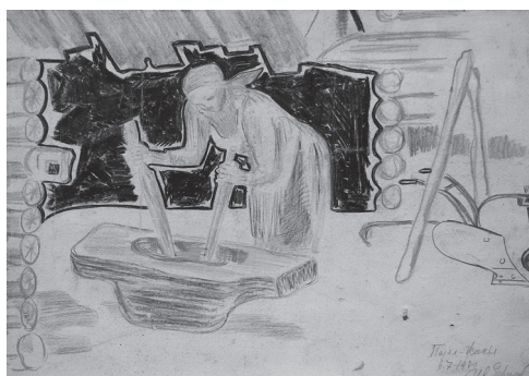
Крестьянка со ступой

Иные вещи кажутся активными и без человеческого участия, люди рядом с ними – стаффаж, дополнение. На других рисунках, наоборот, важнее сам человек, который демонстрирует умение управлять шедеврами народного изобретательства. Пчеловод карабкается по гигантской сосне к борти, привязав к ногам медвежьей когти. Он