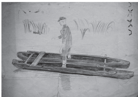
Удмурт в лодке

Рисунки мастера подтверждают, насколько его поразили редкостные по устройству и древней традиции охотничьи капканы и силки, ступа для толчения льняного семени с пестом, оснащенный противовесом, «ботник» – лодка-катамаран из двух выдолбленных бревен, массивное корыто с двумя шестами-толкушками – приспособление для стирки. Изделия деревенских плотников отличаются не только изобретательностью конструкции, но и совершенством пропорций, красотой обобщенных форм. Свойствам крестьянских орудий труда адекватны изобразительные средства рисовальщика. Вещи нарисованы крупно, с размахом, на больших листах плотной бумаги. Не трудно представить, какой нелегкой задачей было носить в пеших походах тяжелую папку, увеличивающую объем и вес от селения к селению. Художник имел солидный набор цветных и черных, разных по мягкости карандашей. Рисунки демонстрируют виртуозное владение ими, а также активное