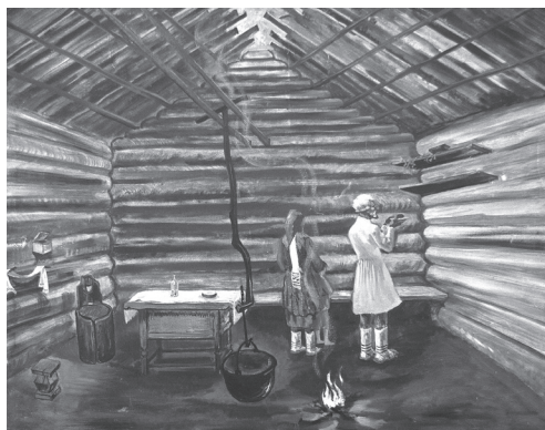
Моление в избе